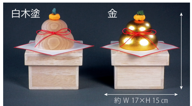
約 W 17×H 15 cm