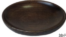
栓 3.5 まめ皿