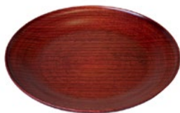
栓 5.5 / 6.0 リント皿

茜すり・神代すり ¥11,000.- (税込) ¥10,000.- (税抜) Φ27×h2 cm 化粧箱入