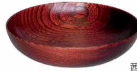
栓 3.8 豆皿

茜すり・神代すり ¥3,190.- (税込) ¥2,900.- (税抜) Φ10.5×h1.5 cm 箱無