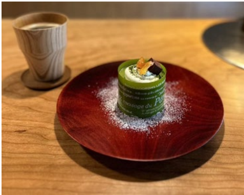
枺 5.0 浅皿 枺 8.0 / 9.0 浅盛皿

茜すり・神代すり ¥3,520.- (税込) ¥3,200.- (税抜) Φ11.5×h2.8 cm 箱無