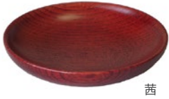
栓 3.0 こまめ皿