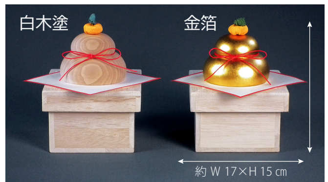
約 W 17×H 15 cm