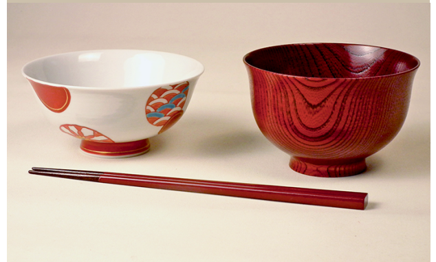
ゆたかセット ¥18,205.- (税込) ¥16,550.- (税抜)