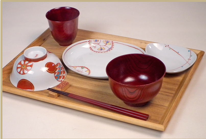
みのりセット (おすすめ) ¥30,085.- (税込) ¥27,350.- (税抜)