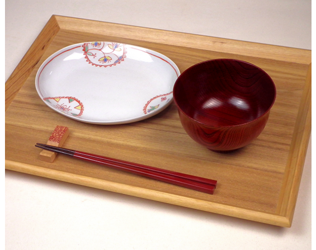
にしきセット ¥12,980.- (税込) ¥11,800.- (税抜)