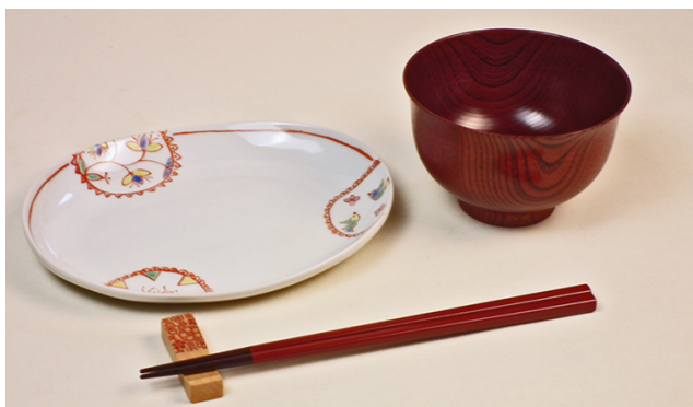
こがねセット ¥12,430.- (税込) ¥11,300.- (税抜)