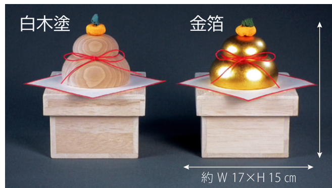
約 W 17×H 15 cm