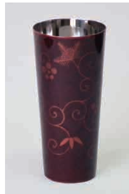
白檀 朱・黒 松竹梅唐草