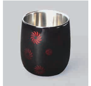
白檀 獅子毛 ※3