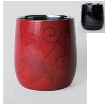
朱・黒 松唐草 ※2