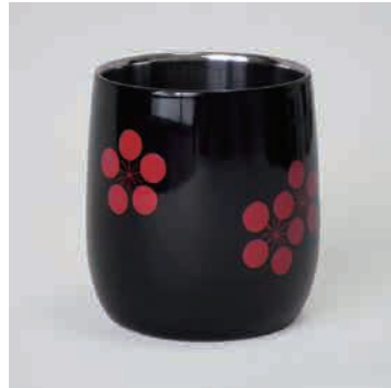
黒 利休梅 ※1